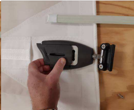
Glissez le capot vers l'arrière pour le retirer du boîtier