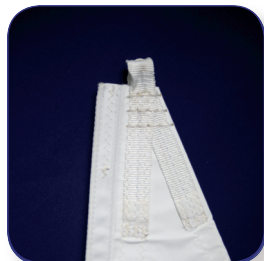
Tête sangle Haute Résistance